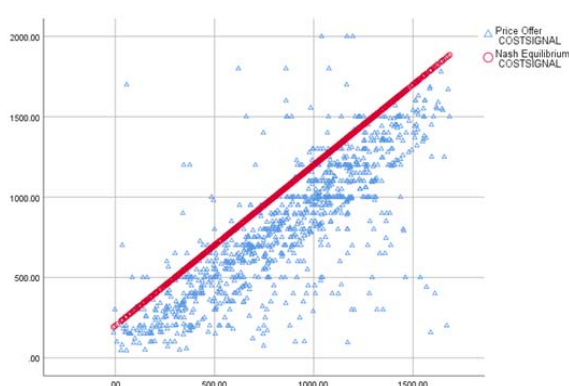
ب. شرایط پیچیده بازار حسابرسی