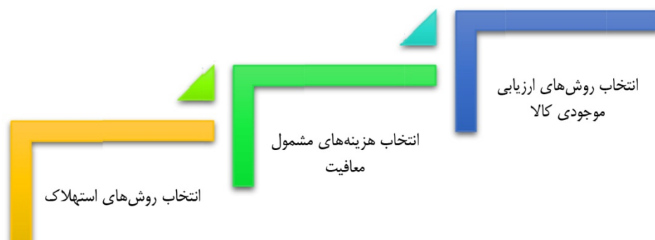
شکل ۲. برخی مصادیق کاربردی حسابداری خلاقانه

بر اساس این تعاریف، موضوع قابل توجه این است که حسابداری خلاقانه فرایندی است تابع انتظارات مدیریت تا با تبدیل اطلاعات مالی واقعی به اطلاعات نادرست، نسبت به برآوردن اهداف و رضایت صاحبان منافع اقدام لازم را انجام دهند. لذا مدیران با فشار بر واحد حسابداری تلاش می‌کنند تا صورت‌های مالی را آنگونه انعکاس دهند که نقض استانداردها و قوانین صورت نگیرد و از این طریق منافع آنان تأمین شود. لذا هوشمندی در استفاده از انعطاف‌پذیری قوانین یا استانداردها همانند، کاهش هزینه‌ها به واسطه انتخاب از میان روش‌های موجود استهلاک در تعیین هزینه استهلاک سالانه؛ اجتناب مالیاتی به واسطه شناسایی هزینه‌های تحقیق و توسعه و یا انتخاب روش‌های ارزیابی موجودی کالا که به بیش ارزش‌گذاری منجر می‌شود می‌تواند مبنای کاربردی حسابداری خلاقانه تلقی گردد.