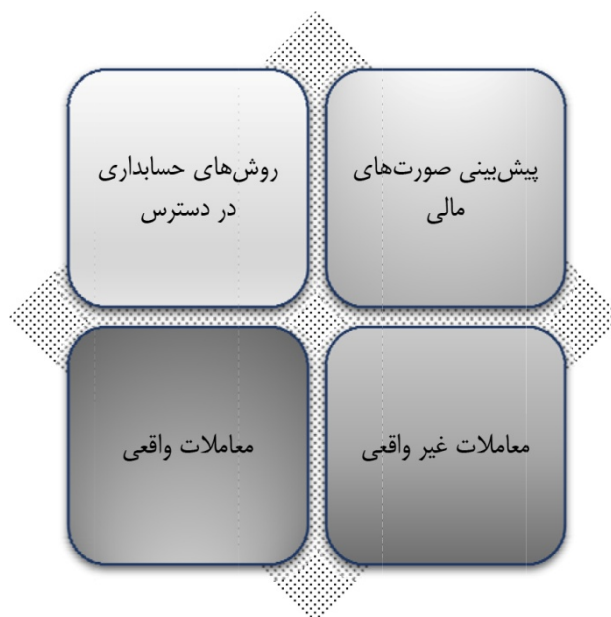
شکل ۳. شیوه‌های حسابداری خلاقانه

از طرف دیگر صالح و همکاران (۲۰۲۱) دلایل ترویج و ترغیب مدیریت به استفاده از حسابداری خلاقانه را شامل نشان دادن یک روند ثابت رشد در سود یا همان هموارسازی سود جهت کمک به دستیابی تحلیلگران مالی به پیش‌بینی رضایت بخش؛ پنهان کردن اخبار بد و حفظ پایداری قیمت سهام می‌داند. همچنین شیوه‌های حسابداری خلاقانه را بر اساس ۴ بعد زیر بیان می‌کنند: