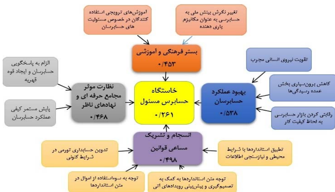
شکل ۲. الگوی مفهومی و ساختاری خاستگاه حسابرس مسئول در ایران