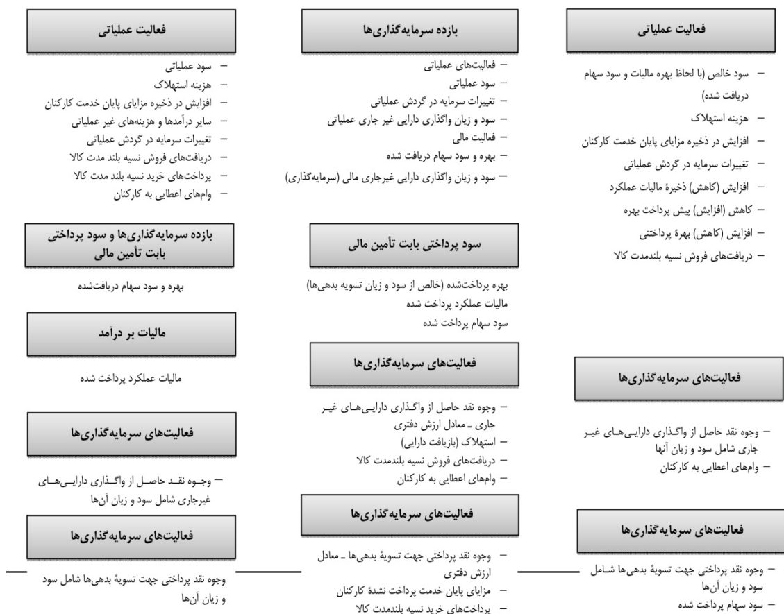
شکل ۱. مدل‌های مختلف ارائه صورت جریان وجوه نقد