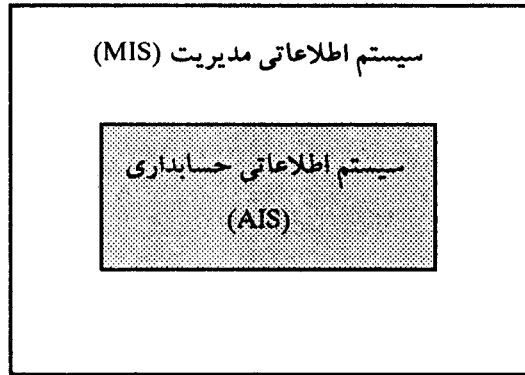
شکل شماره ۲ - سیستم اطلاعاتی حسابداری مهم‌ترین زیر مجموعه سیستم اطلاعاتی مدیریت

بسیاری را در جهت برقراری یک نظام صحیح و کارآمد اطلاعاتی مصروف کنند تا بتوانند وظایف روزمره خود را به انجام برسانند. اما متأسفانه در عمل چنین اتفاقی کمتر رخ می‌دهد. طبیعتاً این سؤال مطرح می‌شود که چرا مدیران نقش و جایگاه سیستم اطلاعاتی مدیریت و در نتیجه سیستم اطلاعاتی حسابداری را جدی نمی‌گیرند؟ در این بخش از مقاله بیشتر درصدد پاسخ به این پرسش هستیم که چرا نظامهای اطلاعاتی حسابداری در سازمانهای ایرانی جایگاه واقعی خود را به دست نیاورده‌اند؟ آیا بدون چنین نظامهایی مدیران قادر به تصمیم‌گیری و جوابگویی در برابر محیط خود هستند؟